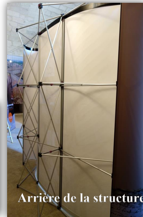
Arrière de la structure