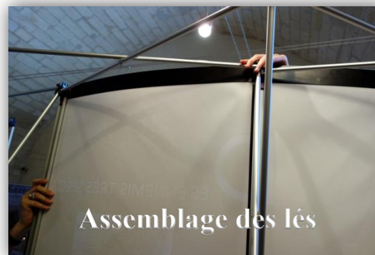
Assemblage des lés