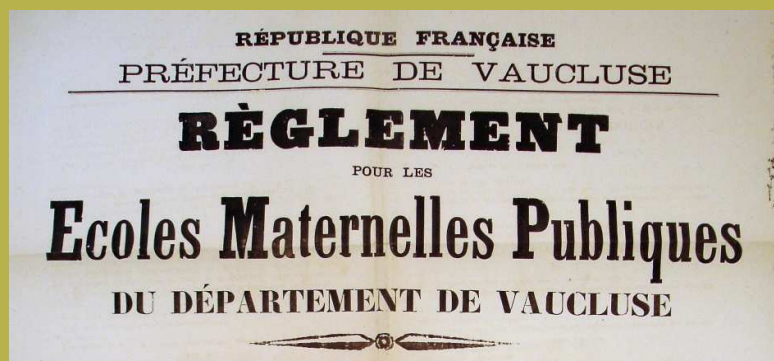
Règlement pour les écoles maternelles publiques. 1888. Arch. dép. Vaucluse 1 T 372