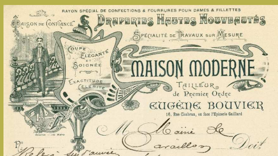
Draperies, hautes nouveautés Eugène Bouvier « Maison Moderne » à Cavailon. Arch. comm. Cavailon 4 L 11