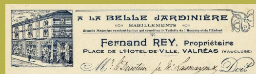
Magasin de vêtements Fernand Rey « À la Belle Jardinière » à Valréas.