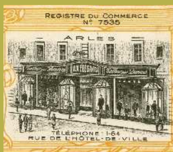
Magasins de vêtements Albert Pitras et Cie « Aux Éléphants » à Arles et Avignon. Musée départemental du cartonage et de l'imprimerie de Valréas.

En parallèle aux soins que l'on apporte au corps de l'enfant, on s'attache à confectionner des objets qui lui sont adaptés, en premier lieu des habits.