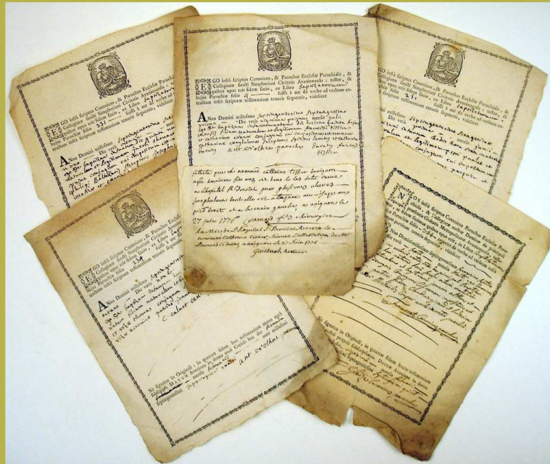
Certificats de baptêmes. Arch. dép. Vaucluse Saint Bénézet F6

La crèche de la Sainte Enfance reçoit les enfants depuis leur naissance jusqu'à deux ans.