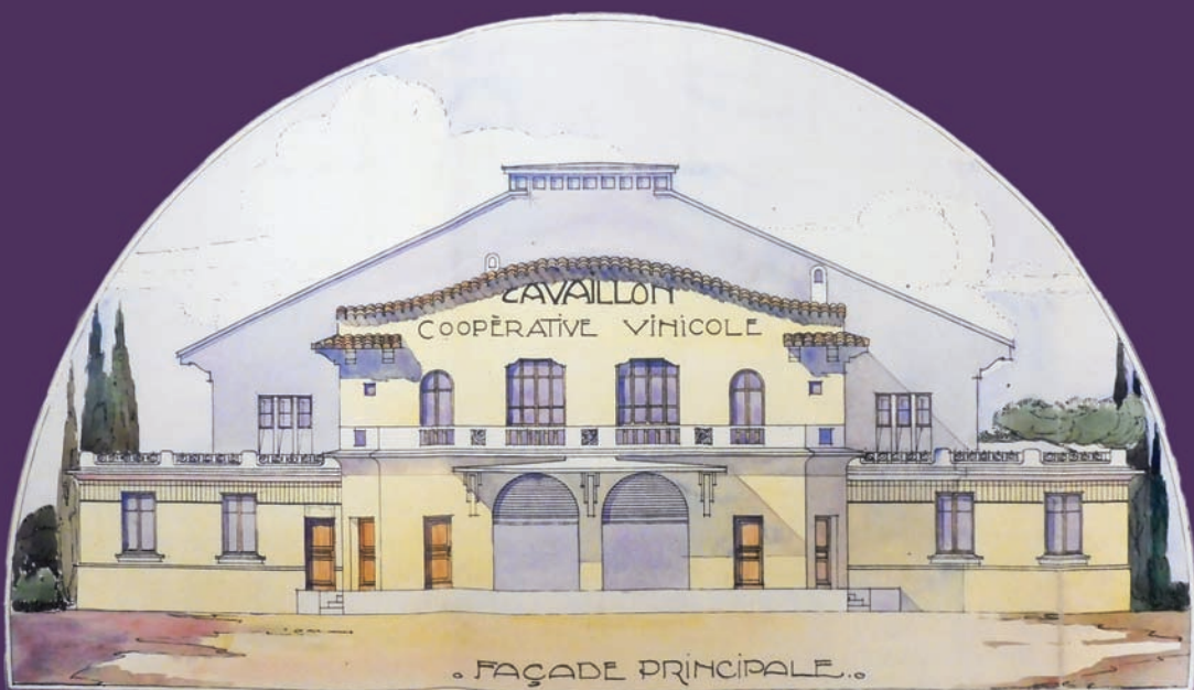
Plan de la façade principale, G. Salomon, architecte, 1925.

EXPOSITION 19 septembre - 23 décembre 2020