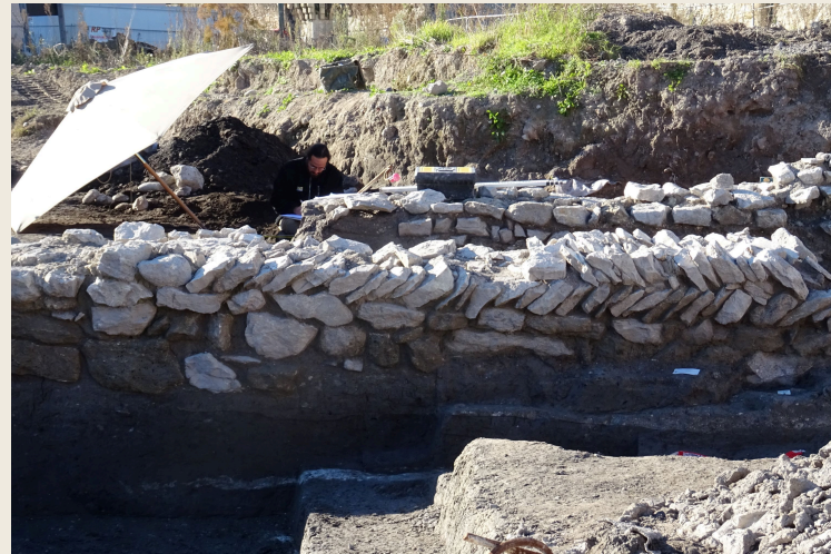
Maçonnerie en arêtes de poisson, 2024 (AD Vaucluse)

Retour, en quelques documents présentés lors des Journées européennes du patrimoine, sur l'année 1944 et son tournant décisif tant espéré.