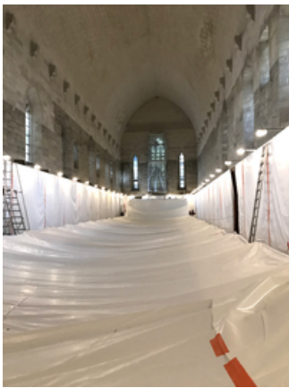
Chapelle bâchée

Créé par le ministère de la Culture en 1984 sous le nom de "Journées Portes ouvertes des monuments historiques", cet évènement, organisé sur un week-end, a pour objectif de montrer au plus grand nombre la richesse extraordinaire de notre patrimoine.