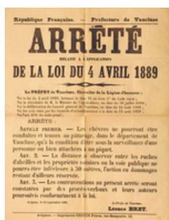
Affiche de l'arrêté portant sur les distances entre les ruches, 1890 (AD Vaucluse 7 M 58)