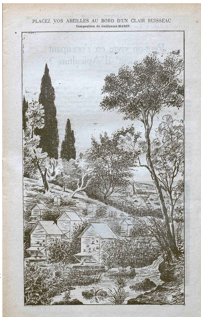
Extrait de la Gazette apicole, n°203, oct. 1921 (AD Vaucluse 5 Per 11)

Quelques années plus tard, en 1895, la Société d'apiculture "l'Abeille de la vallée du Rhône" conteste la réglementation des 50 mètres fixée par le préfet, qui met les apiculteurs "dans l'impossibilité d'exercer leur industrie", parlant même de "prohibition presque complète" ! Les arguments que développe la Société d'apiculture reposent sur le fait que la plupart des départements, et notamment celui du Gard voisin, ont déjà changé cette réglementation, en diminuant à 10 mètres, voire moins, la distance avec les chemins, maisons d'habitation et propriétés riveraines. Ceci pour permettre de rétablir un régime plus équitable avec les départements voisins, afin que les paysans vauclusiens puissent "se livrer à cette industrie dont l'Abeille de la Vallée du Rhône a provoqué le réveil et encourage le développement dans le département de Vaucluse, dont la flore se prête si merveilleusement à l'élevage des abeilles" !