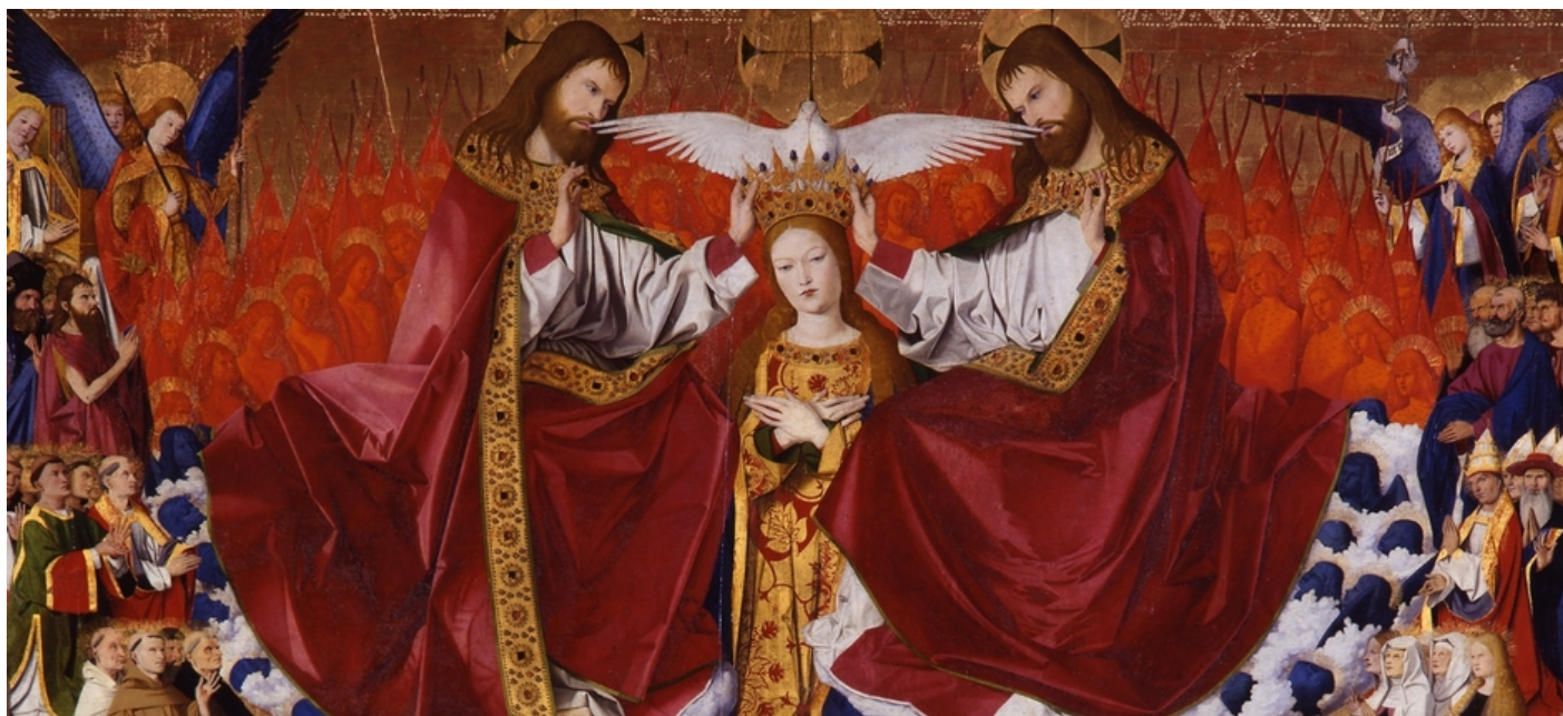
Couronnement de la Vierge, Enguerrand Quarton, 1453-1454. Musée Pierre de Luxembourg, Villeneuve-lez-Avignon

Une source remarquable car la plupart des prix-faits des peintres provençaux de la fin du Moyen Age ont été perdus.