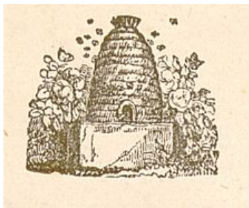
Détail d'une ruche en paille sur l'en-tête d'un courrier de l'association "L'Abeille de la vallée du Rhône", s.d. (AD Vaucluse 7 M 58)

La première association apicole vaclusienne se forme en 1894 à Avignon sous la dénomination « l'Abeille de la vallée du Rhône »