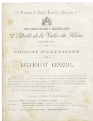
Règlement de l'exposition de 1900 du 27 octobre au 7 novembre (AD Vaucluse 7 M 23)