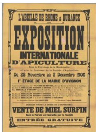
Affiche de l'Exposition internationale de 1906 (AD Vaucluse 7 M 23)