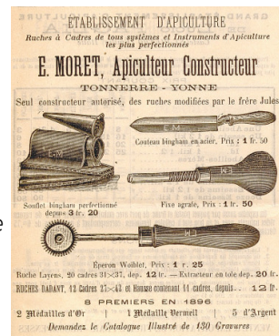
Revue l'Abeille de la vallée du Rhône, extrait d'une publicité, août 1898 (AD Vaucluse 2 T 29)