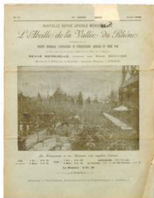
Couverture de la revue l'Abeille de la vallée du Rhône, n° 17, août

Curieusement, le choix de « l'en-tête » qui figure sur le courrier est un dessin de ruche en paille, soit le contraire des idées progressistes que l'association défend !