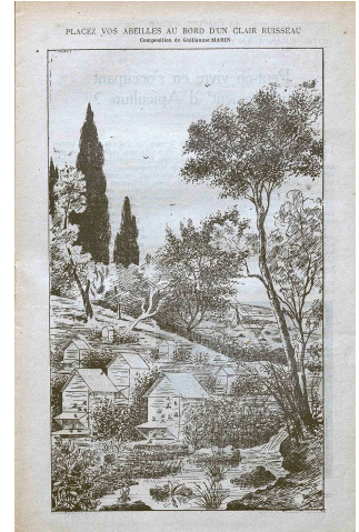
Extrait de la Gazette apicole, n°203, oct. 1921 (AD Vaucluse 5 Per 11)