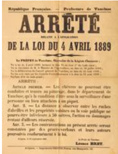
Affiche de l'arrêté portant sur les distances entre les ruches, 1890 (AD Vaucluse 7 M 58)