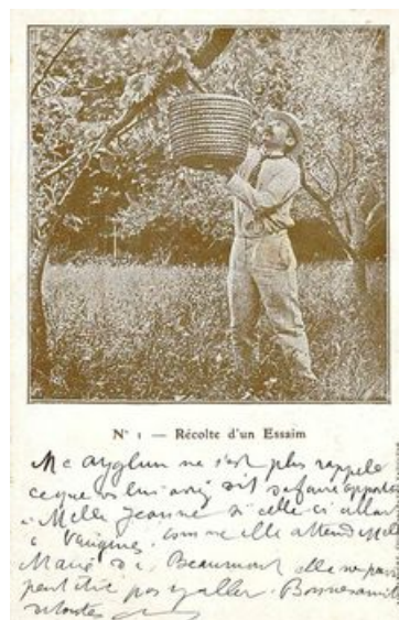
Essaimage, carte postale Alphandéry

Pour certaines communautés, les statuts traitent essentiellement de police champêtre, de tout ce qui est source de contestations possibles, susceptibles de nuire à la tranquillité publique. Textes bien vivants, renouvelés, modifiés et réformés tout au long du Moyen Âge et de l'époque moderne, les statuts disparaissent à la Révolution; mais leur influence a survécu dans les "usages locaux" et certains arrêtés municipaux du XIXe siècle.