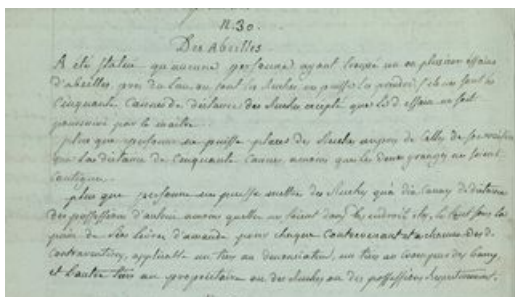
Statuts communaux de Malaucène, 1763 (AD Vaucluse 4 E 18)

En apiculture traditionnelle, l'essaimage est très fréquent et la grande question est de savoir à qui appartiendra l'essaim vagabond. Les textes sont souvent similaires : l'essaim égaré appartiendra au propriétaire des ruches les plus proches. La distance est bien entendu précisée, c'est elle qui autorisera ou non la "cueillette" de l'essaim : ce peut être à la distance d'un jet d'arbalète, comme à Malaucène en 1598, souvent à 100 pas (Mazan, Vaison) ou encore 150 pas (Faucon en 1786) ou même 200 pas (Malemort). Si toutefois l'essaim est poursuivi par son maître, cette mesure ne s'appliquera pas, à condition de le "suivre à vue d'œil" (Venasque en 1638). Passé cette distance, l'essaim trouvé peut aussi être partagé entre le propriétaire du lieu où il s'est posé et la personne qui l'aura trouvé : ainsi à Malemort ou à Faucon en 1786 : "les essaims posés à plus de 150 pas appartiendront par moitié au maître du fonds où ils se seront posés et à celui qui les aura trouvés". Plus rarement, la capture de l'essaim n'est assortie d'aucune condition : c'est le cas à Séguret en 1654, où "tout le monde aura le droit de prendre un essaim sortant de ses ruches là où il ira".