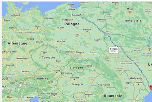
De la France à la Prusse-Orientale