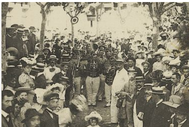
Les sociétés musicales sérignanaises dans les archives

Avant d'entrer dans le détail de l'objet et du traitement envisagé pour lui rendre un peu de son lustre d'autrefois, quelques lignes sur les sociétés musicales.