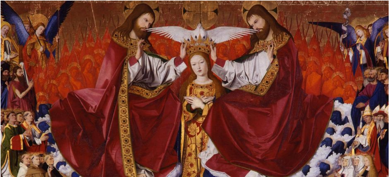
Couronnement de la Vierge, Enguerrand Quarton, 1453-1454. Musée Pierre de Luxembourg, Villeneuve-lez-Avignon

Une source remarquable car la plupart des prix-faits des peintres provençaux de la fin du Moyen Age ont été perdus.