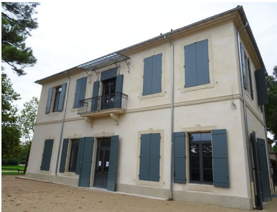
Le château Gentilly à Sorgues, aujourd'hui propriété de la commune