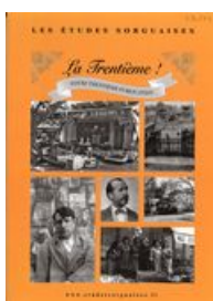
Fascicule n°30 de la revue Les Études sorguaises, 2021