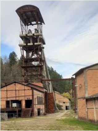
Puits Ricard

Les Maureau prospèrent dans le commerce de charbon.