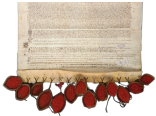
Exposé de l'élection d'Urbain VI par douze cardinaux réunis à Anagni, 2 août 1378 (AD Vaucluse 19 H 64 / 2)