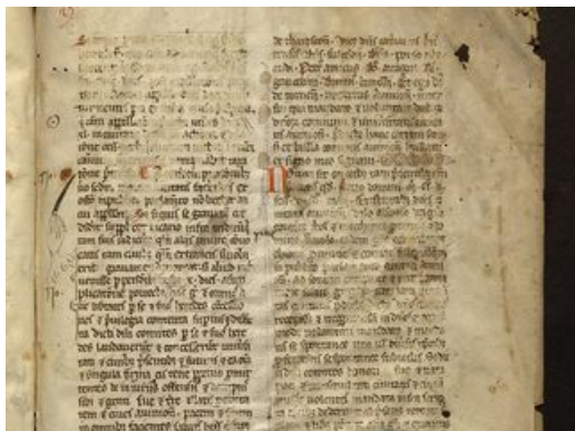
Convention passée à Beaucaire entre Alphonse, comte de Toulouse, marquis de Provence, Charles, comte de Forcalquier et la ville d'Avignon, 7 mai 1251 (Arch. com. Avignon AA 3)