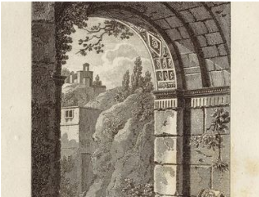
"1ère vue d'un arc de triomphe à Cavaillon, département de Vaucluse", début XIXe siècle. Estampe sur papier du début du XIXe siècle (AD Vaucluse 2 fi 1008) © Bence, Baugean

Depuis les temps les plus reculés, les hommes ont perçu le caractère propice et spectaculaire de cet environnement naturel. Les groupes humains de la période paléolithique ont cheminé au fil des saisons et du cours des eaux pour trouver leur subsistance. Puis des communautés sédentaires se sont réparties en territoires d'autosuffisance grâce à la pratique de l'agriculture et de l'élevage.