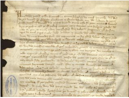
Chapitre collégial Saint-Pierre d'Avignon, droits sur le cimetière et droits de funérailles, 7 novembre 1308 (AD Vaucluse 9 G 7 /24)