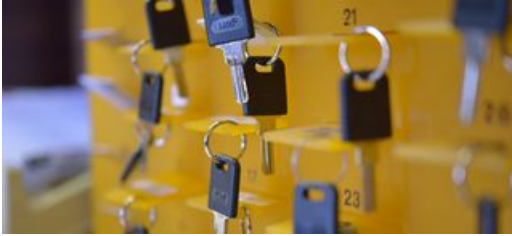
Clefs des casiers de consigne de la salle de lecture des archives départementales de Vaucluse

Pour en savoir plus sur le fonctionnement de la salle de lecture, consultez l' espace lecteur