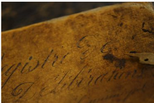
La Terreur, le curé et le registre des délibérations de Saint-Marcellin-les-Vaison