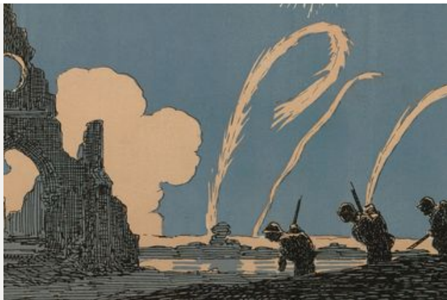
La bataille de la Somme