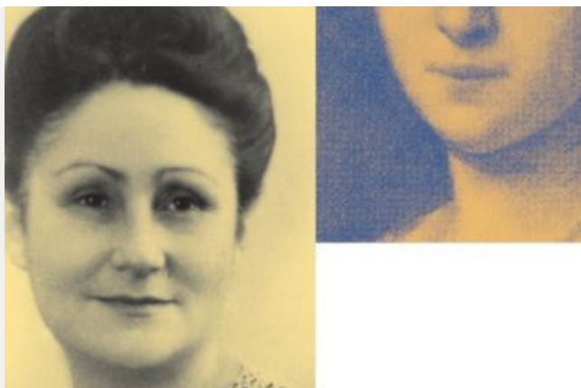
La Résistance au féminin