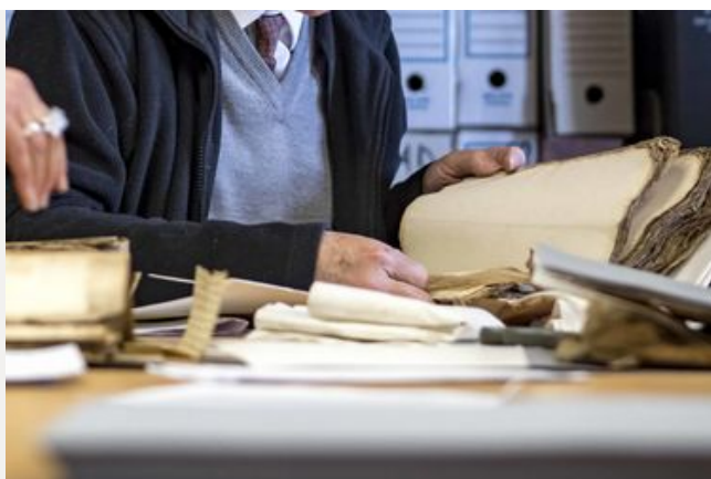
Je m'inscris, je commande, je consulte