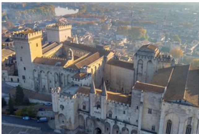
Je viens aux archives

Retrouvez dans cette rubrique les renseignements essentiels pour préparer votre visite : accès, fonctionnement de la salle de lecture, pré-demande de document, formulaire de dérogation, reproduction, manipulation des documents et commande de publications.