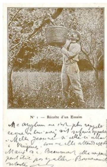
Essaimage, carte postale Alphandéry

Pour certaines communautés, les statuts traitent essentiellement de police champêtre, de tout ce qui est source de contestations possibles, susceptibles de nuire à la tranquillité publique. Textes bien vivants, renouvelés, modifiés et réformés tout au long du Moyen Âge et de l'époque moderne, les statuts disparaissent à la Révolution; mais leur influence a survécu dans les "usages locaux" et certains arrêtés municipaux du XIXe siècle.