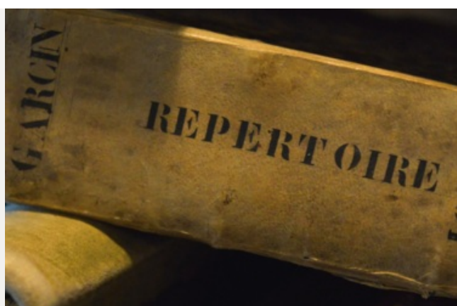
Le versement des minutes et répertoires