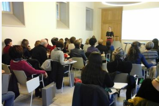
Les acteurs de l'archivage

La bonne gestion des archives est un atout incontournable de la modernisation de l'administration, en sécurisant l'action publique, en améliorant son efficacité, en garantissant une information de qualité, sur la longue durée, et en garantissant ainsi les droits des citoyens.