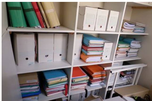
Les archives en pratique